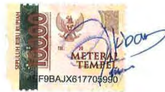
Khoirul Akbar Etlanda