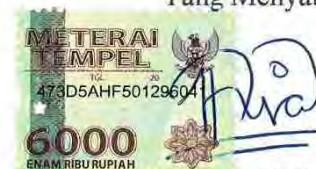
Devita Fauziah Syafitri