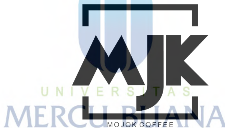
Gambar 6 : logo Mojok Coffee