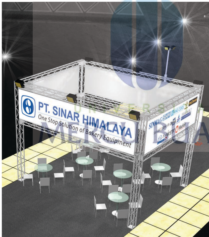
Gambar 17 : desain booth pameran