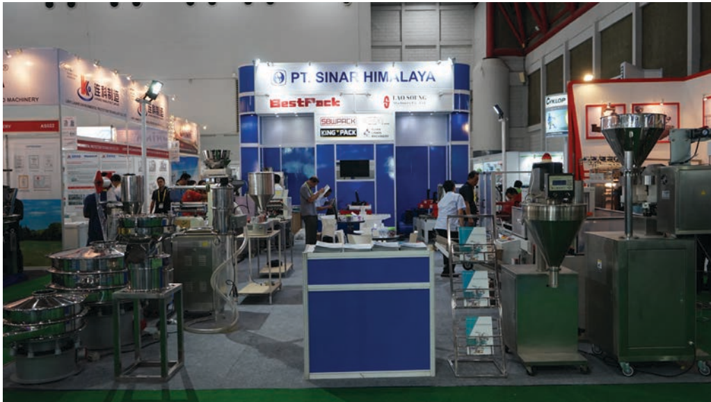
Gambar 22 : foto pameran allpack Indonesia