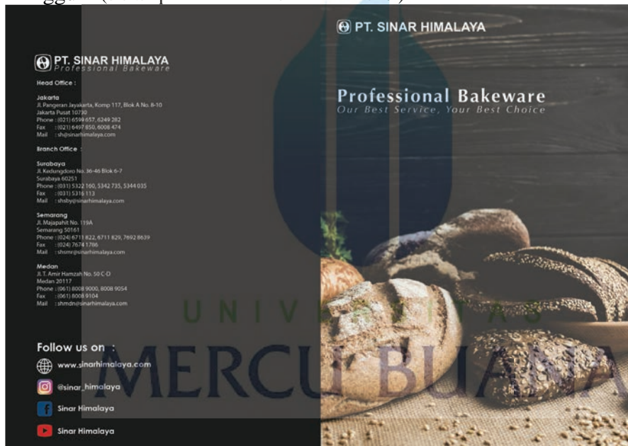
Gambar 9 : Cover Catalog Bakeware