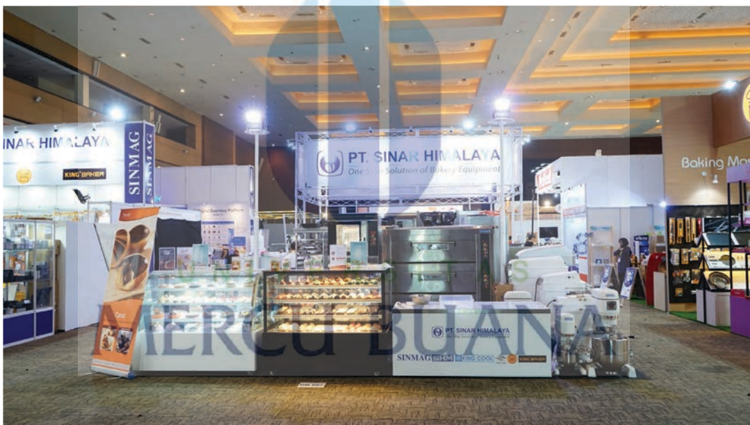
Gambar 27 : foto pameran SIAL Interfood 2019