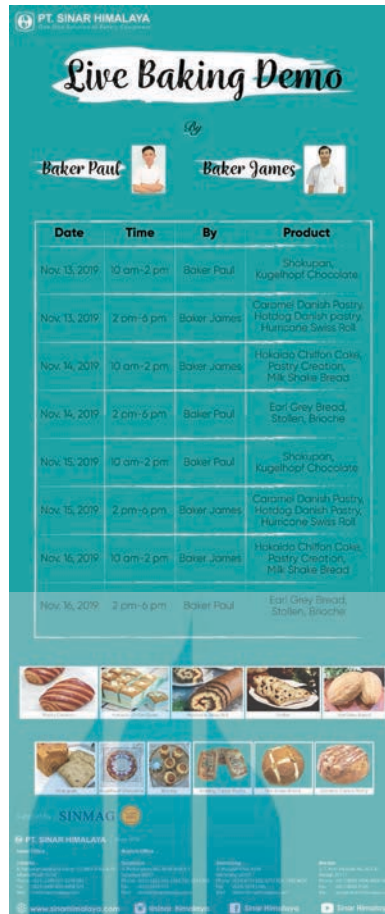
Gambar 20 : desain roll up banner