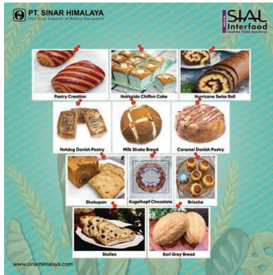
Gambar 26 : desain content social media