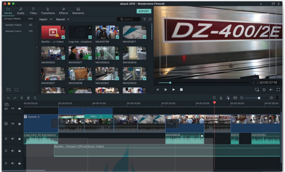
Gambar 28; proses editing video allpack indoneisa