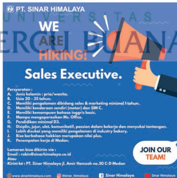
Gambar 21 : desain job vacancy