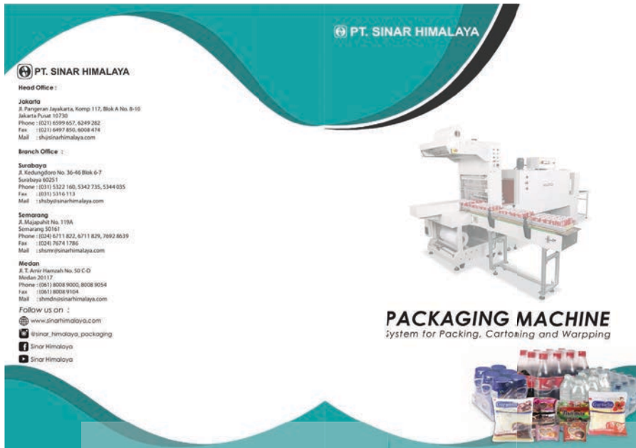
Gambar 10 : Cover Catalog Packaging