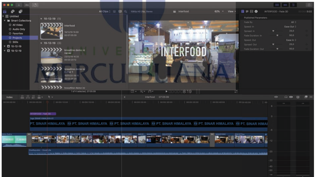
Gambar 29 : proses editing video SIAL Interfood 2019