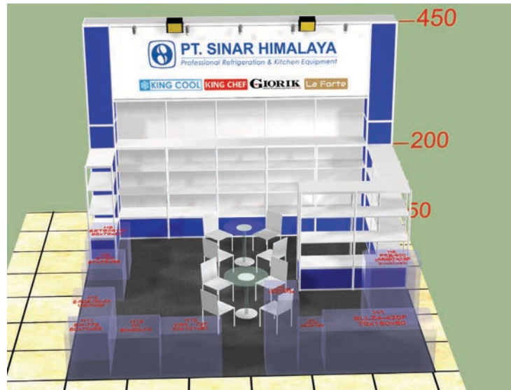
Gambar 16 : desain booth pameran