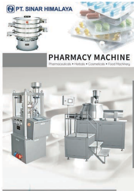
Gambar 12 : Cover catalog pharmacy