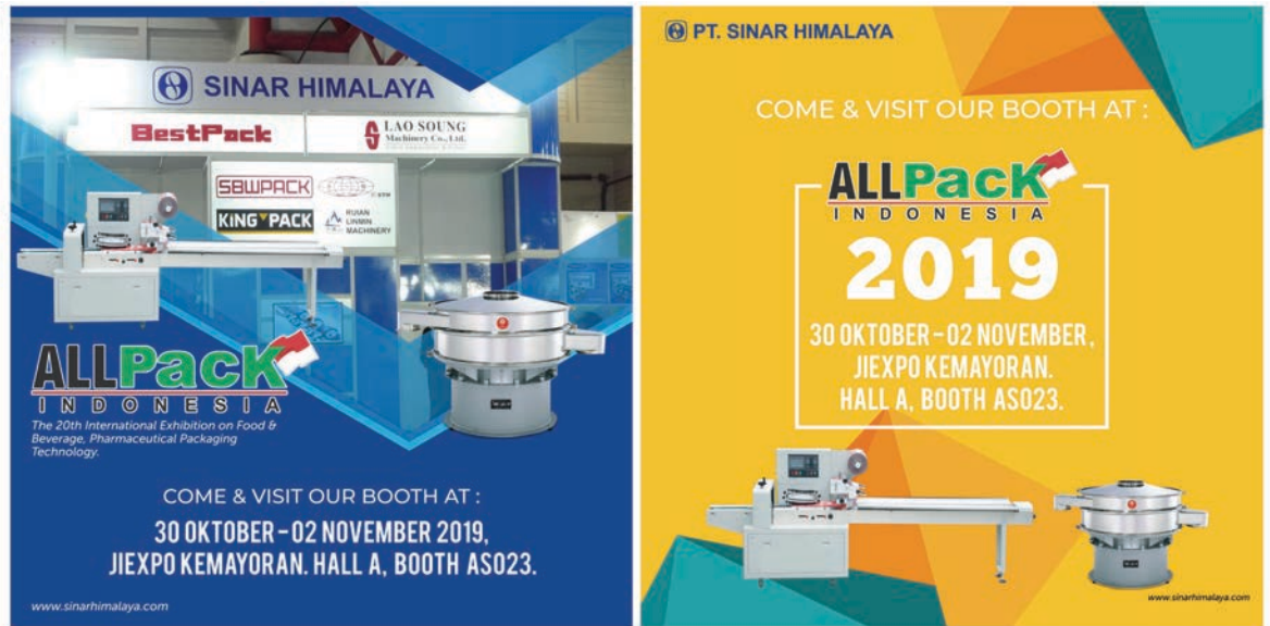
Gambar 18 : desain content social media