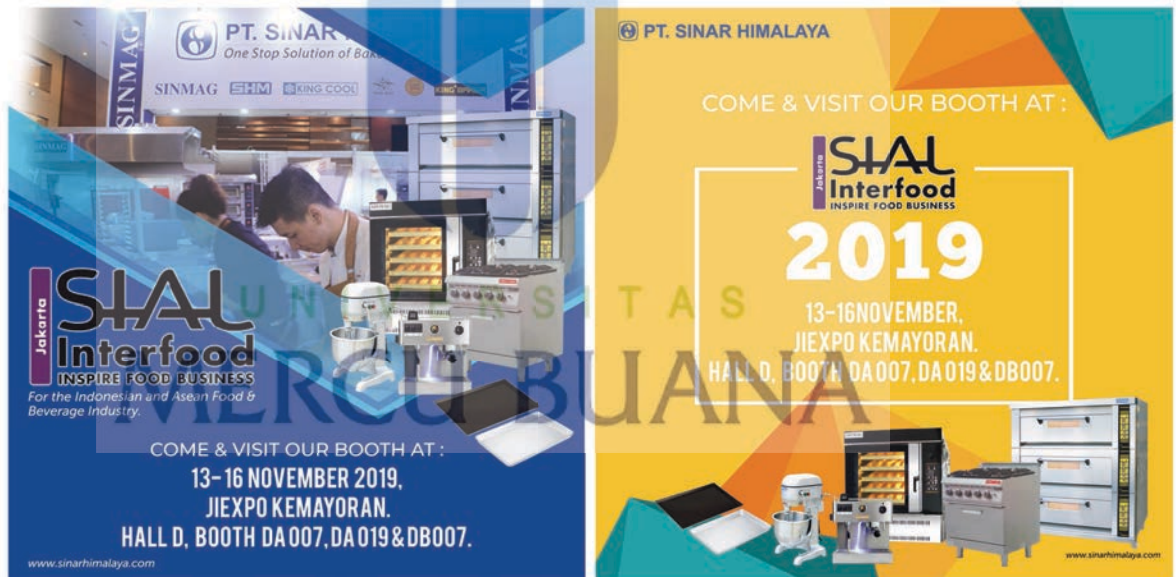
Gambar 19 : desain content social media