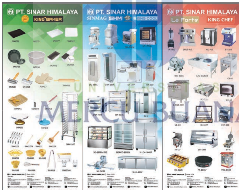
Gambar 11 : Desain roll up banner