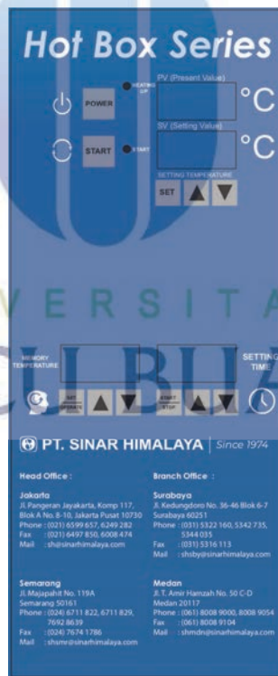
Gambar 13 : Desain control panel