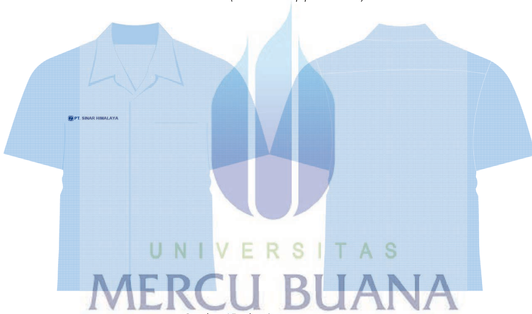
Gambar 15 : desain seragam pameran