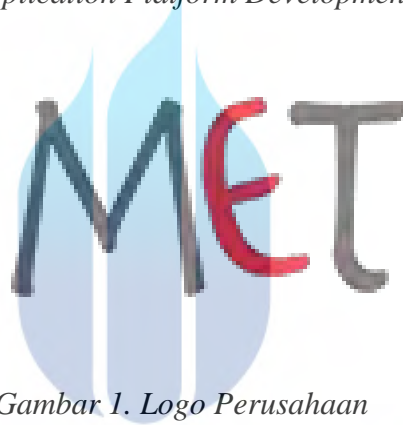
Gambar 1. Logo Perusahaan

PT Mitra Erat Technology merupakan perusahaan Kreatif yang berfokus di bidang Web and Mobile Application Platform Development .