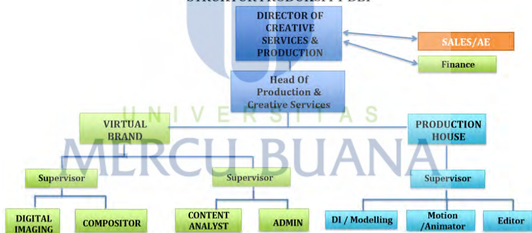
Bagan 2 Struktur Produksi PT. DBI