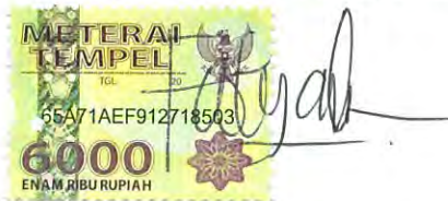
Fatih Yaumilia Fadnan