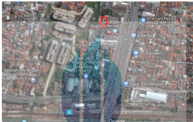
Gambar 2.1 Lokasi Proyek Gedung Abadi Klender

Lokasi pengerjaan Proyek Pembangunan Gedung Abadi Klender terletak di Jl. Bekasi Timur No 7 Rt 02/ Rw 02 Pulo Gadung , Jakarta Timur.