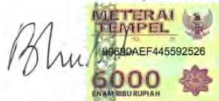
Bhira Muslim Marathony