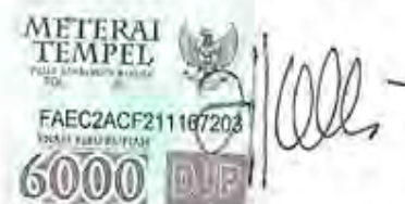
Nur Intan Pangesti Subrianto