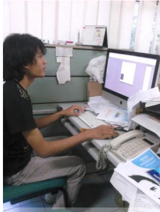
Gambar 49. Praktikan sedang mengerjakan tugas layout Probank