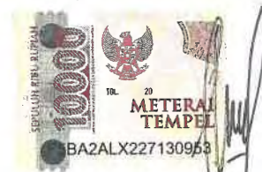
Imelda Siska Hutajulu