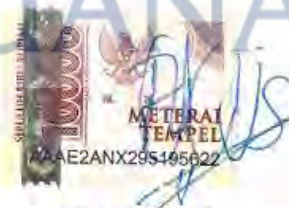
Arlis Syukron Nst