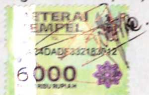
Achmad Taufiq Hidayat