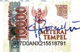
Indi Puan Maharani